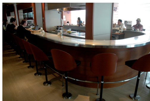
Internet-annex ontbijtcafé, Tokyo

MKB Servicepoint heeft kennis en ervaring opgedaan met het in de wijk faciliteren van vanuit huis werkende ondernemers. Tijdens de pilot werden voor en met de ondernemers uiteenlopende activiteiten georganiseerd, zoals een ondernemerscafé. De zelfstandigen ontwikkelden ook onder begeleiding gewenste oplossingen. Zo werd een neutrale, onafhankelijke en laagdrempelige infrastructuur gerealiseerd in de wijk, bestaande uit een website, plek en netwerk, die communicatie via verschillende kanalen faciliteert. De website www.mkb-servicepoint.nl brengt ondernemers virtueel bij elkaar. Er zijn plekken in de wijk voor fysieke ontmoeting. De vereniging Zolo brengt de ondernemers samen in de structuur van een vereniging. Voor vanuit huis werkende ondernemers is de woning de basis voor een flexibele werkstijl. Op het niveau van de wijk groeit de samenwerking en het gebruik van faciliteiten om professioneler te werken. En zij hoeven alleen met de auto op pad als zij elders moeten zijn.