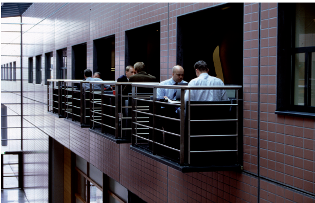
Overlegbalkons in het kantoor van Interpolis, Tilburg

Utrecht-West kan op landelijk niveau uiteindelijk een duurzame win-winsituatie opleveren voor alle betrokkenen: minder CO 2 -uitstoot, minder luchtvervuiling én een krachtiger en gezonder economie. En duurzame oplossingen hoeven niet vanzelfsprekend nieuw gebouwd te worden. Bij MKB Servicepoint gaat het in eerste instantie om het beter ontsluiten van alle faciliteiten en beter benutten van de voorzieningen, die er al in de wijk zijn. Denk aan faciliteiten op het gebied van sport, welzijn, gezondheid en cultuur.